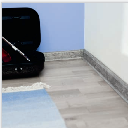
EFFECTOR QUEEN EFFECT – szeroki wybór listew cokołowych z wysokiej jakości PVC do podłóg z naturalnego drewna lub paneli. Kolekcję wyróżnia bogata kolorystyka, unikalna konstrukcja i wyjątkowe parametry użytkowe.