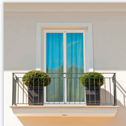
EFFECTOR OPTIMA EFFECT – system umożliwiający wykonywanie okien drewniano-aluminiowych. Zewnętrzna nakładka aluminiowa stanowi element bardzo odporny na warunki atmosferyczne, a zarazem niezwykle dekoracyjny.