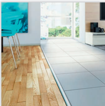
EFFECTOR STANDARD EFFECT – bogata kolekcja listew wykończeniowych z aluminium anodowanego, okleinowanego lub mosiądzu. Oferta zawiera profile do łączenia różnych powierzchni podłóg: drewna, wykładzin, płytek ceramicznych, kamienia naturalnego i paneli.