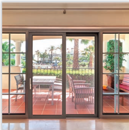
EFFECTOR EDEN EFFECT – aluminiowe drzwi podnosząno-przesuwne, produkowane na bazie systemu MB-77 HS, dostępne w szerokiej gamie kolorystycznej. Zastosowanie takiego rozwiązania minimalizuje koszty ogrzewania zimą oraz zmniejsza częstotliwość używania klimatyzacji w okresie letnim.