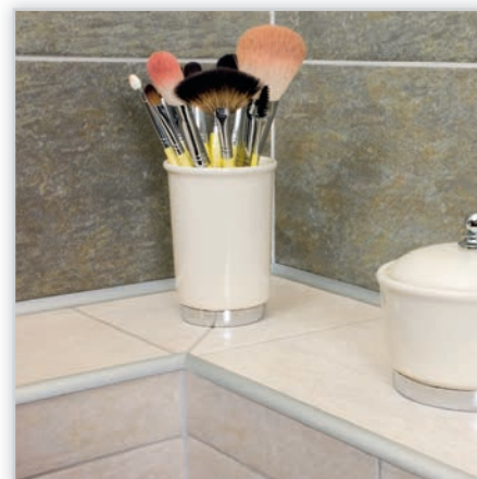
EFFECTOR IMPRESJA EFFECT – dekoracyjne listwy z aluminium lub mosiądzu do eleganckiego zabezpieczania brzegów powierzchni wewnątrz o różnym przeznaczeniu, wyłożonych płytkami ceramicznymi.