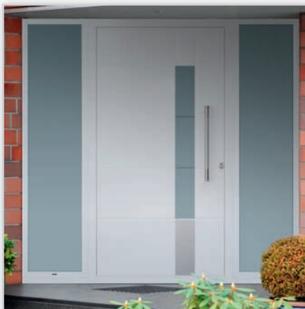
EFFECTOR DRZWI WEJŚCIOWE PANELOWE , produkowane na bazie systemu Aluprof MB-86. Producent 21 modeli dostępnych w szerokiej gamie kolorystycznej.