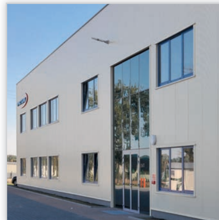
EFFECTOR STOLARKA PRZECIWPÓŻAROWA wykonywana z najwyższej jakości profili aluminiowych oraz szkła zespolonego. Zapewnia bardzo dobre parametry izolacyjności termicznej.